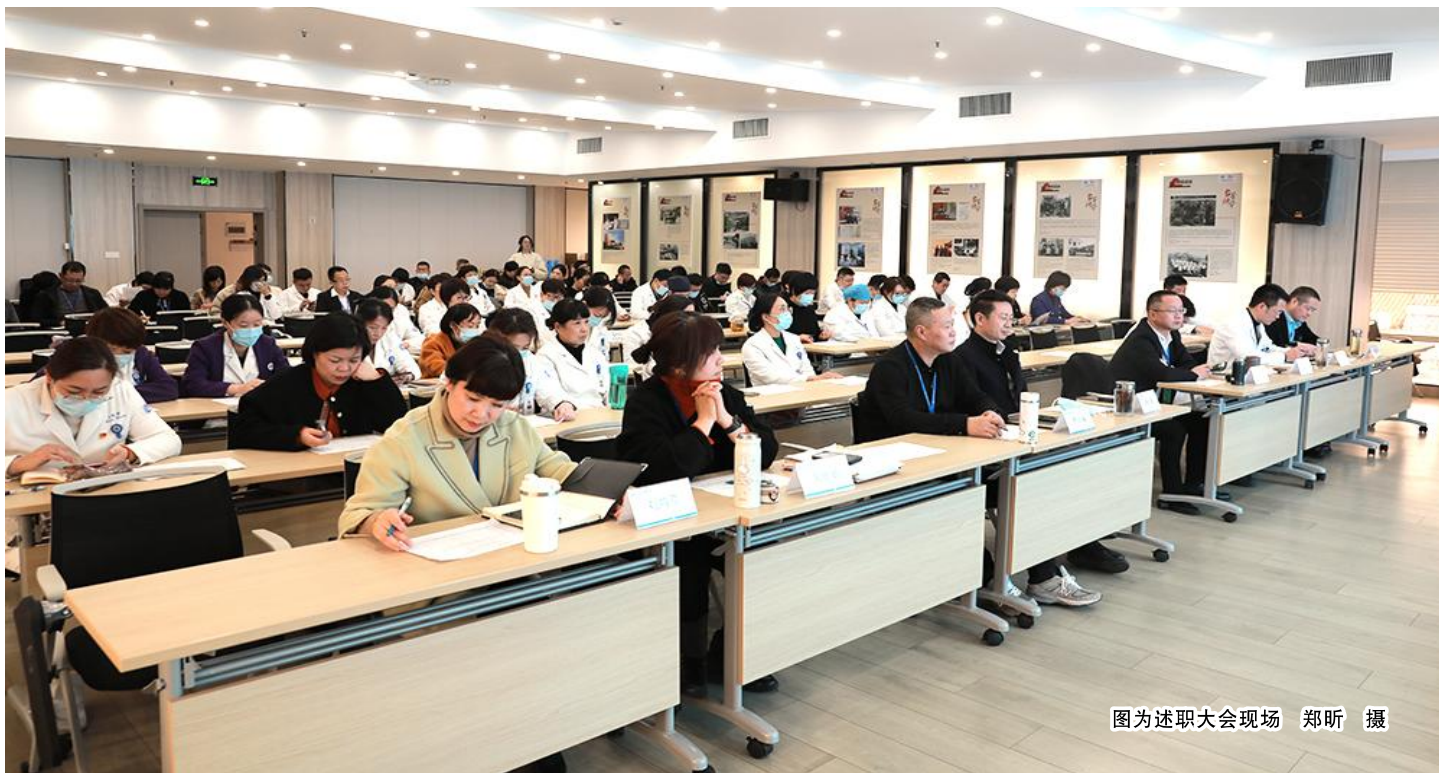
图为述职大会现场

本报讯(记者 郑昕)2月20日,在台州市肿瘤医院医共体召开的2022年度干部述职大会上,徐