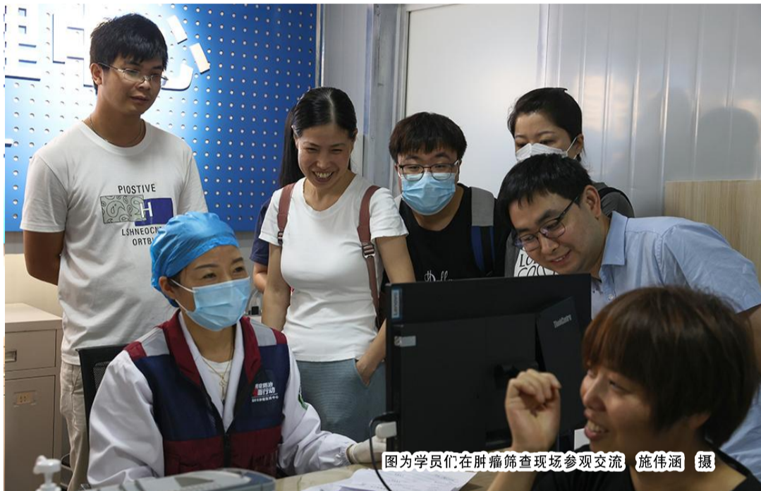
图为学员们在肿瘤筛查现场参观交流

本报讯(记者 郑昕 通讯员 郑西)8月15日,浙江省肿瘤防治办公室组织今年第一期癌症筛查与早诊培训班10名学员,来到浙江省肿瘤医院台州院区,进行为期三天的癌症筛查现场实践学习交流。